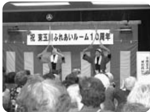
『すだれシスターズ』による南京玉すだれ