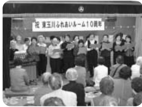
『グループHAT』によるコーラス