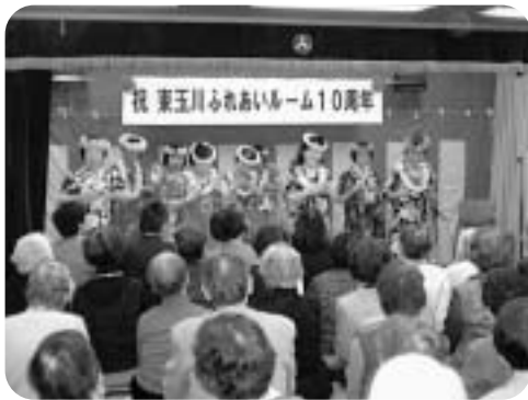
『すいとん』によるフラダンス