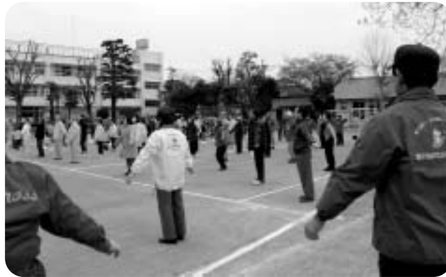
全員でラジオ体操

去る3月28日の日曜日、深沢小学校校庭にて、深沢地区社会福祉協議会主催の第1回目の『深沢地区ふれあい運動会』を開催しました。 「紅白玉入れ」、「ラケットリレー」、「借り物競争」、「大玉ころがし」、「パン食い競争」の5種目、競技総参加者数約600名により、盛大に開催されました。