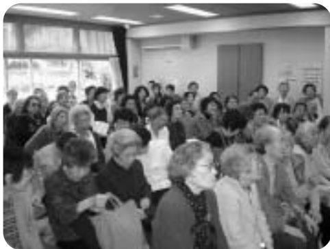
会場は大にぎわい!!