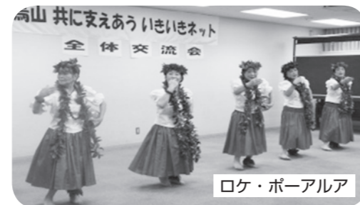
ロケ・ポーアルア