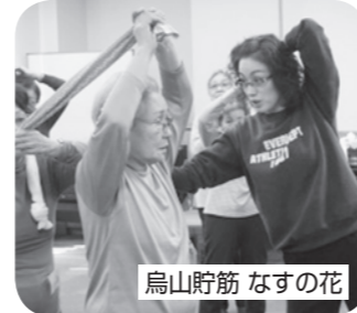
烏山貯筋 なすの花