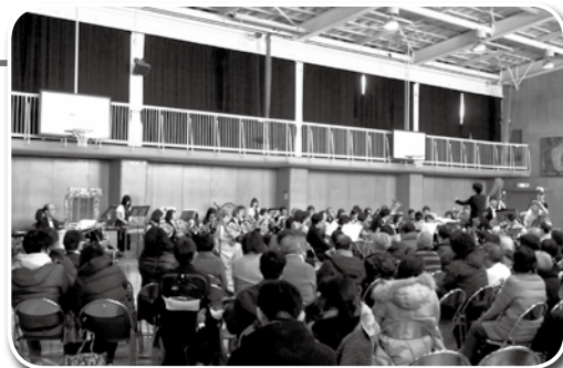
クリスマスコンサート(昨年の様子)

毎年行われてきたクリスマスコンサートが、今年度はニューイヤーコンサートとして実施されます。 日 時：1月26日 午後2時～ 会 場：代沢小学校体育館