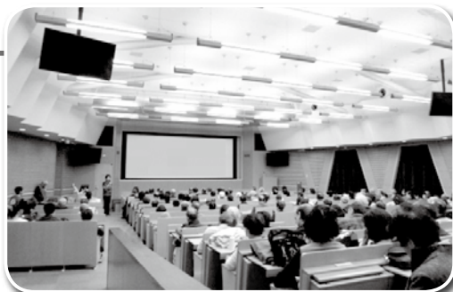
高齢者映画のつどい