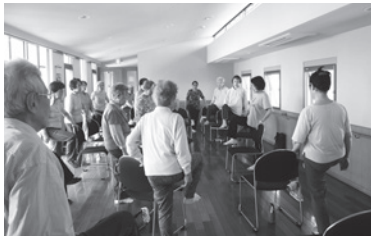
サロンやまぼうし

このような課題の解決に向け、サロン等の定期的な活動場所として、会場提供をお願いしています。