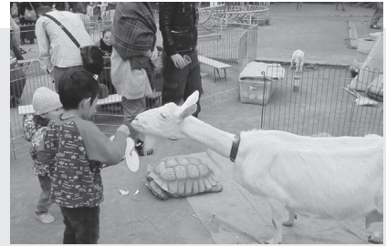
小動物ふれあい交流会