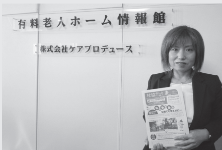
有料老人ホーム情報館 (株)ケアプロデュース (玉川3-14-5 2F)