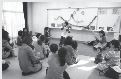
うさちゃんぽっぽ事業