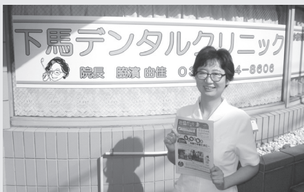
下馬デンタルクリニック (下馬2-25-17 1F)