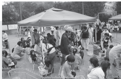
小動物ふれあい交流会