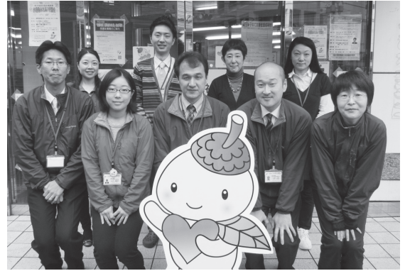
世田谷区社協キャラクター