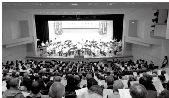
<ココロンの演奏会>