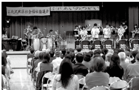
<ふれあいのつどい>