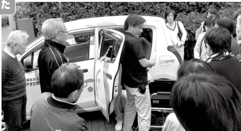
<久我山園理学療法士による車椅子介助の説明>

烏山地区では、介護士・看護師など多様な専門職がいる福祉施設や事業所の特性を活かし、サロンやミニデイなどの地域活動団体へのお出張講話(介護予防・健康増進・福祉サービス等)を開始しました。11月には、久我山園の協力で烏山地区社会福祉協議会「ココロの会」の研修を行いました。引き続き、地区内の福祉施設のチカラ(人・場所等)を活用し、福祉施設事業と地域住民との交流機会を広げる取り組みを行ってまいります！