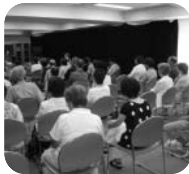
祖師谷地区社協主催「多世代交流イベント」での1コマ

それぞれの地区社協がよりよい地区を目指して、特徴を生かした事業展開をし、安全安心のまちづくりを進めています。今後の各地区社協の活動にご注目ください。