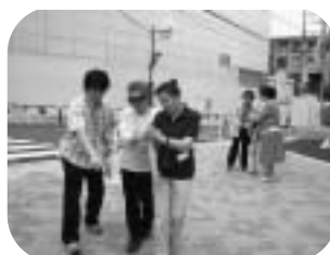
アイマスクによる視覚障害の体験②