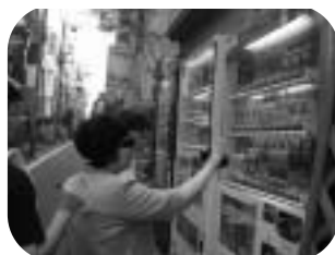
アイマスクによる視覚障害の体験①