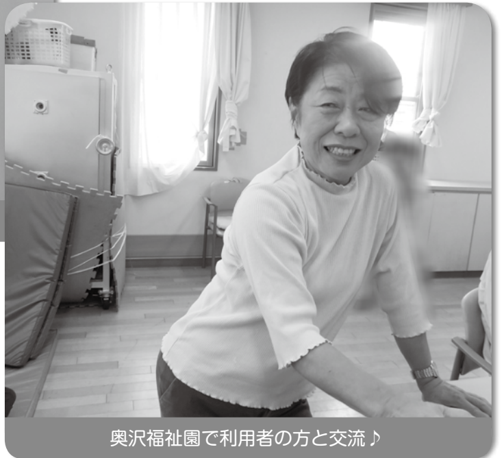
奥沢福祉園で利用者の方と交流♪