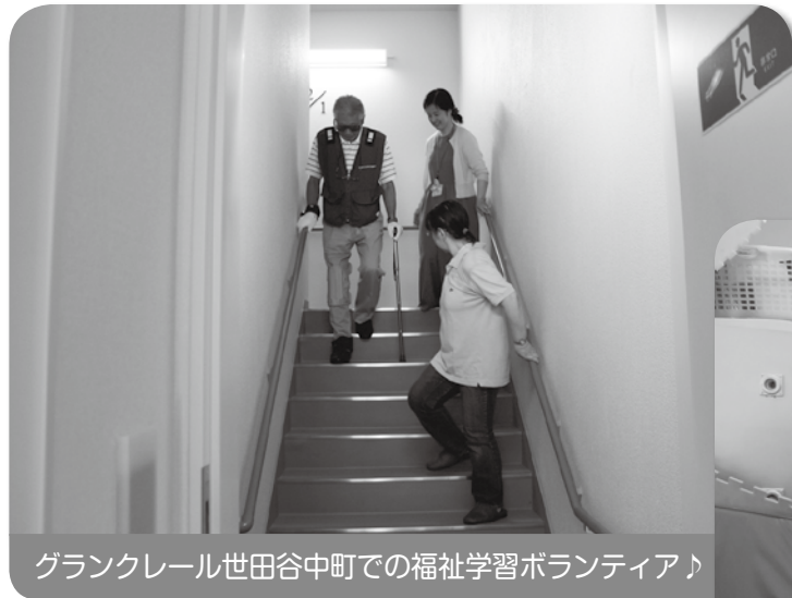
グラントレール世田谷中町での福祉学習ボランティア♪