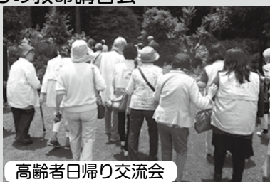
高齢者日帰り交流会