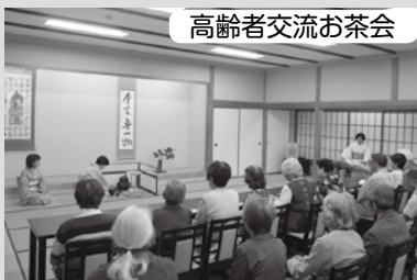
高齢者交流お茶会