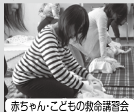
赤ちゃん・こどもの救命講習会