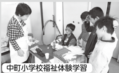
中町小学校福祉体験学習