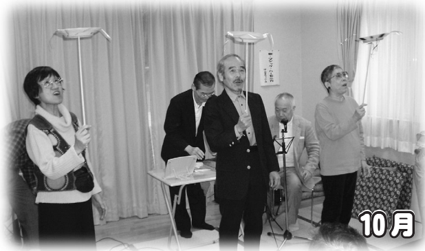
↑南烏山ふれあいまつり