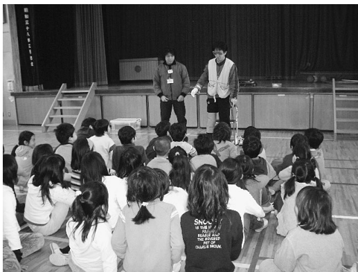
(上北沢小学校への福祉体験学習)