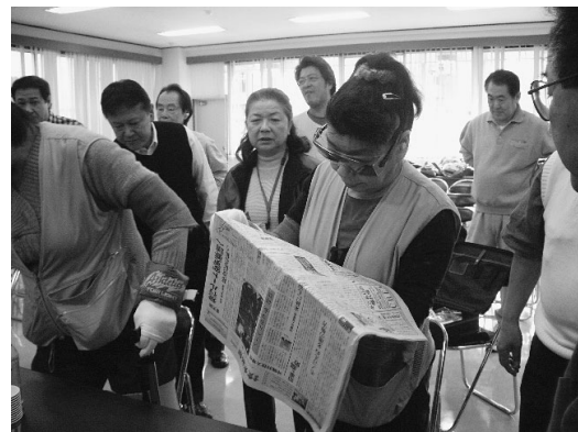
(理容組合梅ヶ丘・砧支部への福祉体験学習風景)