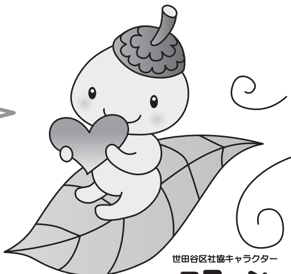
世田谷区社協キャラクター

ココロンの詳細は3月15日にリニューアル予定の社協ホームページのココロン紹介ページで見られるよ!