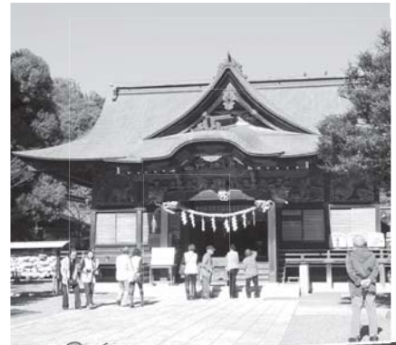
高齢者バス交流会