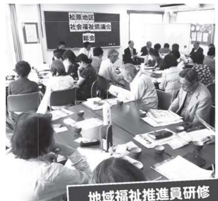
地域福祉推進員研修