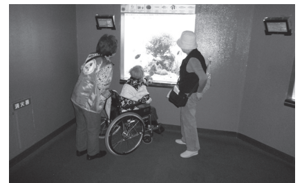
高齢者バス交流会