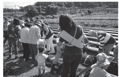
バス交流会（お芋掘り）