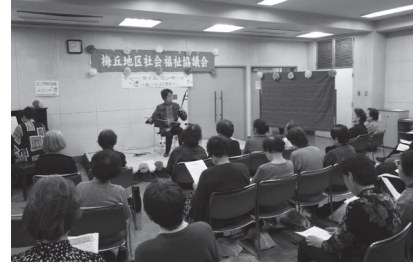
高齢者エリア別交流会（代田）