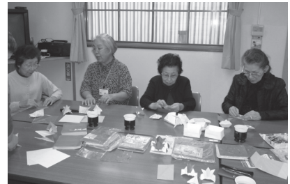
ミニわなげサロン