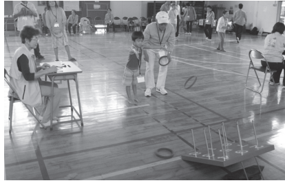
多世代交流 わなげ大会