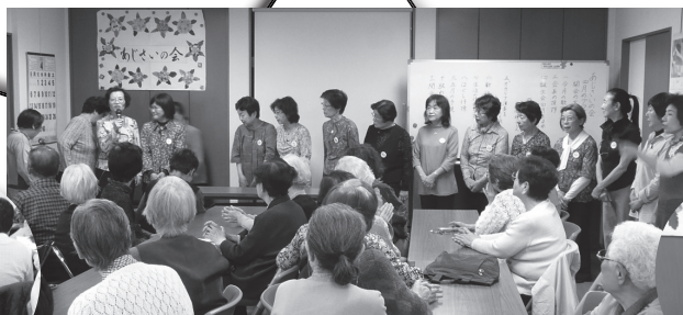
スタッフの皆さん

勤めていた時は、地域との交流がなかったのですが、今は、サロンを通して知り合った方と道で会うことも多く、声をかけあっています。