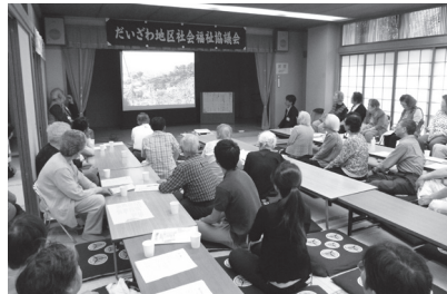
地域でつどいましょう