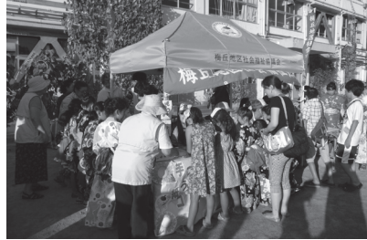
城山小学校なつまつり