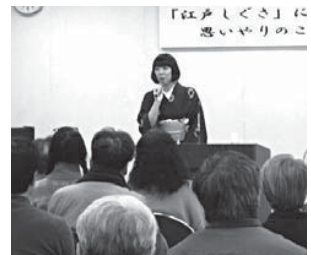
「江戸しぐさに学ぶ思いやりの心」をテーマにした講演会を実施しました。(3月)