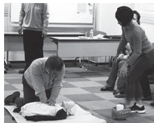
普通救命講習会を実施しました。(2月)