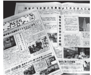
H27年3月発行の「おくさわコロロン」 <第25号記念号>福祉体験学習特集号