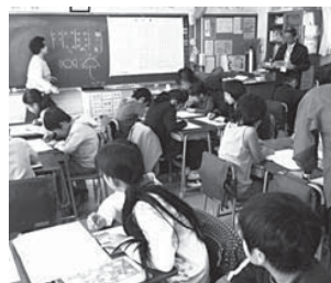
深沢小学校で点字体験を実施しました。