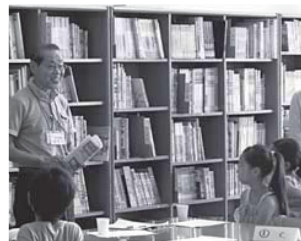
中町小学校 夏休みふれあい教室の様子