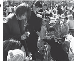
初めて実施した「小動物ふれあい交流会」大盛況でした。