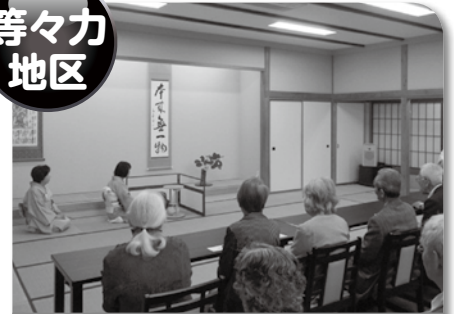
高齢者交流お茶会