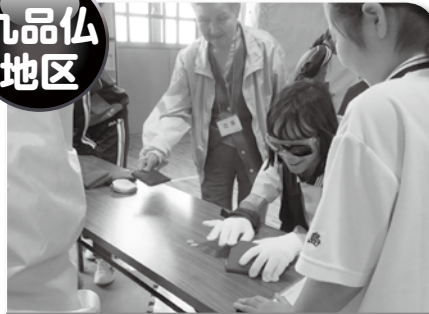
福祉体験学習支援