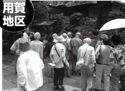
高齢者日帰り交流会