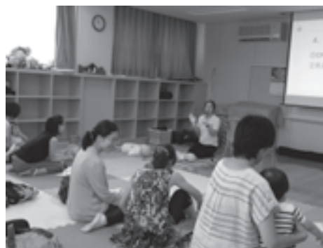
〈子どもの救命講習会〉