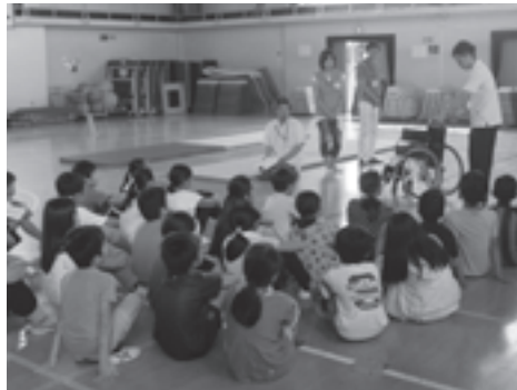
〈福祉体験学習の様子〉