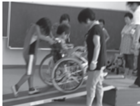
〈【中町小学校 夏休みふれあい教室】の様子〉