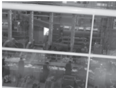
〈エフピコ関東リサイクル工場見学〉

各地区社協に関するお問い合わせは…玉川地域社会福祉協議会事務所 TEL：3702-7777 FAX：3702-7861