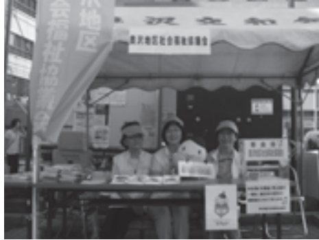
〈奥沢地区祭礼でのPR活動〉