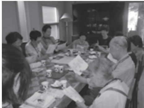
〈第3回 巡回おたのしみ会 「えんがわinn」にて〉