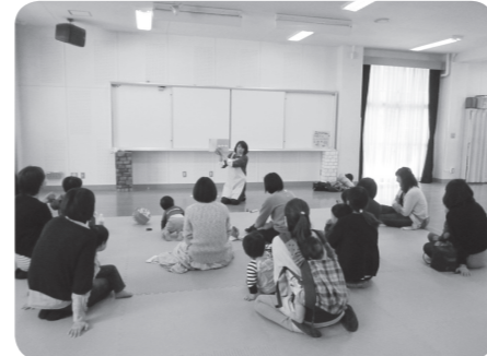
うさちゃんぽっぽ