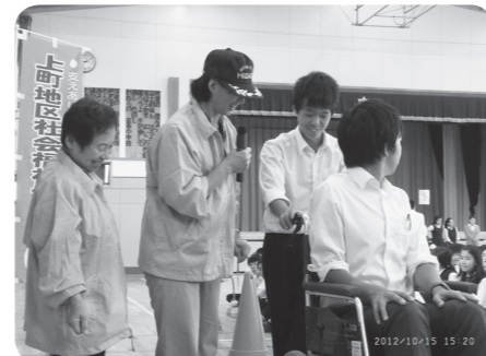
地域事業参加 （三校合同避難訓練）