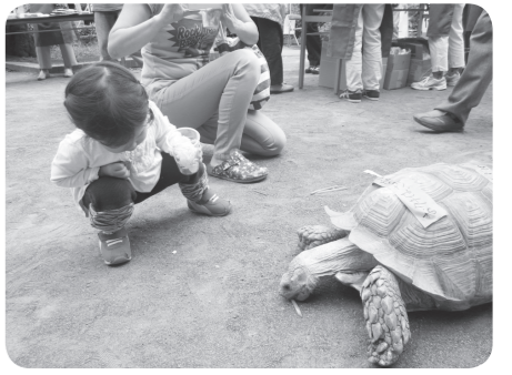
小動物ふれあい交流会