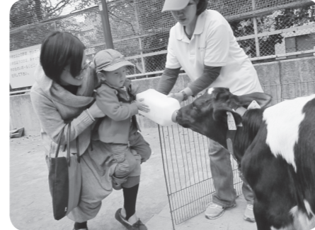
小動物ふれあい交流会