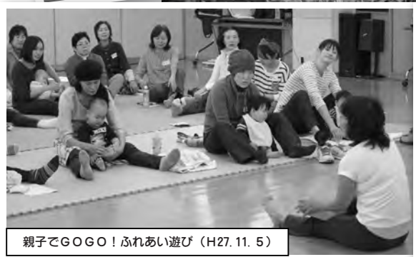
親子でGOGO!ふれあい遊び(H27.11.5)