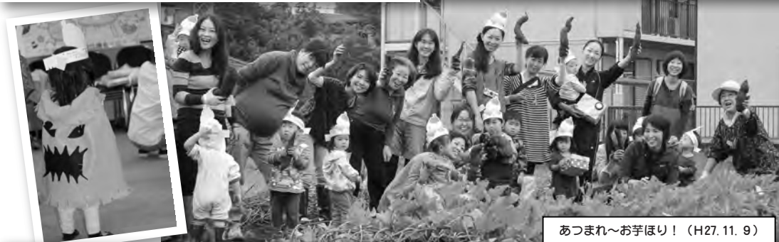
あつまれ〜お芋ほり！(H27.11.9)