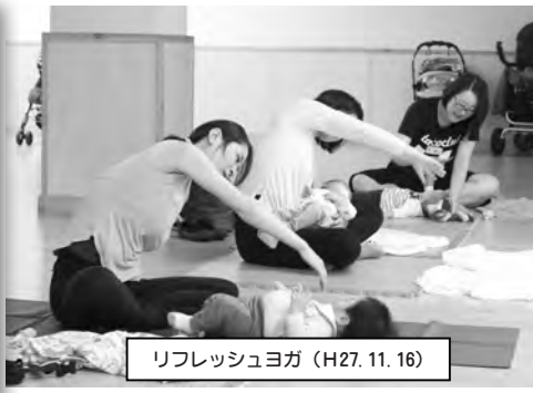
リフレッシュヨガ(H27.11.16)