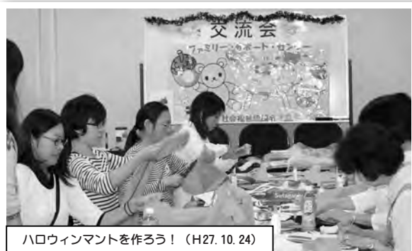
ハロウィンマントを作ろう！(H27.10.24)

初めての試みでしたが、参加いただいた方には楽しいひと時となりました。 来年も企画する予定ですので、ふるってご参加ください。