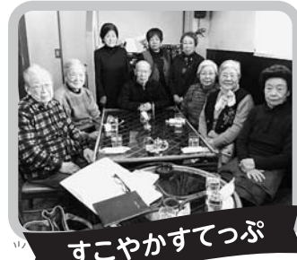
すこやかすてっぷ