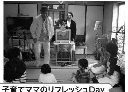
子育てママのリフレッシュDay