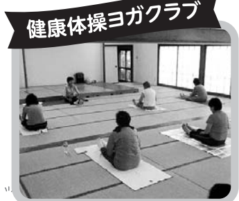
健康体操ヨガクラブ