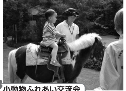
小動物ふれあい交流会