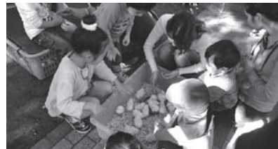
【ふれあい小動物園】

今年度は、毎年参加している松原小学校のデイキャンプにおいて「昔あそび・雑巾がけ競争」、松原3・4丁目自治会様との連携による「ふれあい小動物園」、ご高齢の方向けの「新春松原落語会」など、子供から大人まで多くの世代の方々に笑顔で楽しんでもらえる活動に取り組みました。