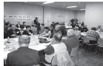
6グループに別れてのグループ懇談

第2回は、66グループ 73名の方が参加されました。グループ別の懇談では、「スタッフとして心がけていること、工夫していること」をテーマに、「参加者募集」や「プログラムの企画」の工夫などたくさんの意見を出し合い、今後の活動に向けて知恵とパワーを分け合えた時間でした。