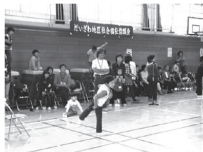
【わなげ交流大会】 地域の交流と子どもからお年寄りまでの多世代の交流が目的で、得点が入るたびに大きな歓声があがりました。