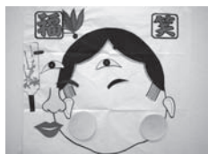
お正月の活動は、「福笑い」を楽しみました。