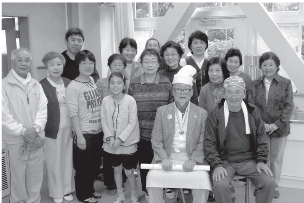
ふれあいいきいきサロン「大原南・山ぼうしの会」の皆さん