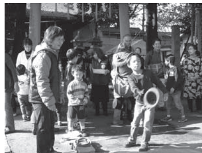
【あきぞら交流会】 北エリアの交流会として大原稲荷神社で行いました。芋煮の配布や輪なげ、演芸を楽しみました。