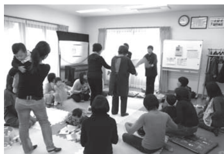
子育てサロン 松原子育て応援隊

●● 地域福祉活動団体助成金交付団体 ●● 《世田谷区重症心身障害児（者）を守る会》 助成事業・・・日帰り体験学習 おかげ様で重症心身障害児（者）が、日常から離れて大型バスに乗り、めったに行く機会のない中華街で食事をしたことは、子どもたちにとって大変良い機会となりました。毎日在宅介助している親もリフレッシュできました。 ありがとうございました。