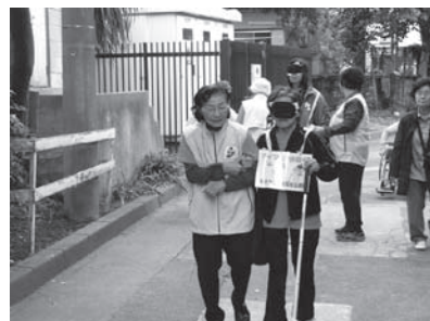
【しろやま倶楽部フェスティバル】 車いす体験・視覚障害の疑似体験コーナーで出展しました。福祉の輪が広がっていきます。