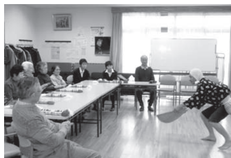
ふれあいいきいき サロン 「やつ手の会」