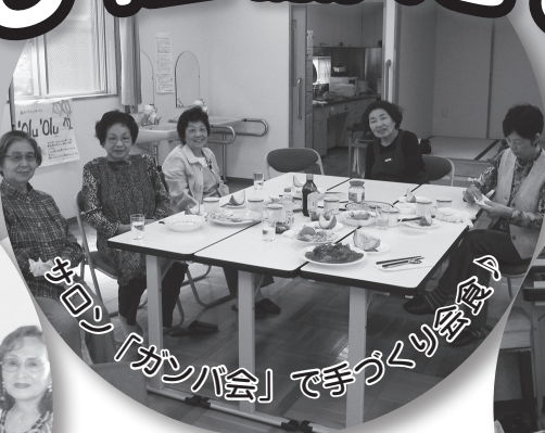
テイクアウト「カンパ会」で手作り会食♪