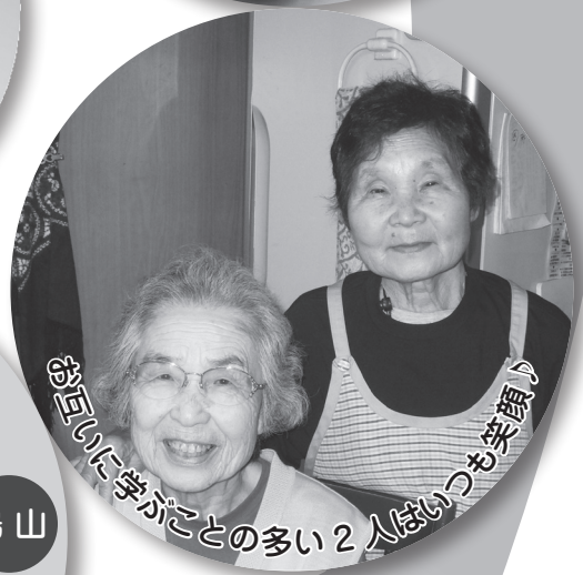
お互いに学ぶことの多い2人はいつも笑顔♪