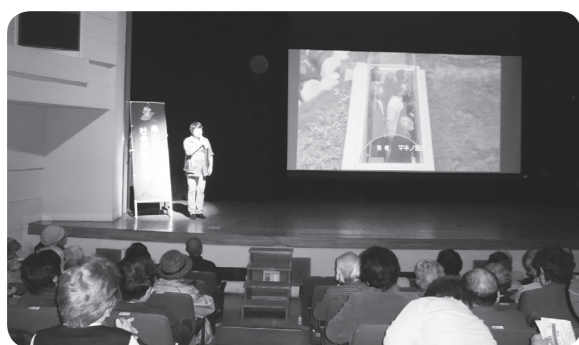
ふれあい映画会「旭山動物園物語」を上映し、359名の参加がありました。