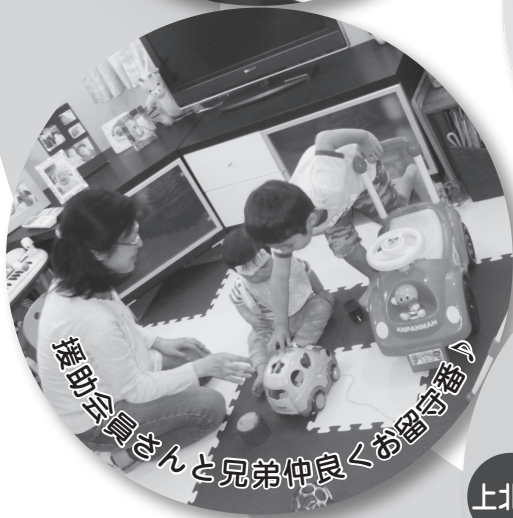
援助会員さんと兄弟仲良く留守番♪