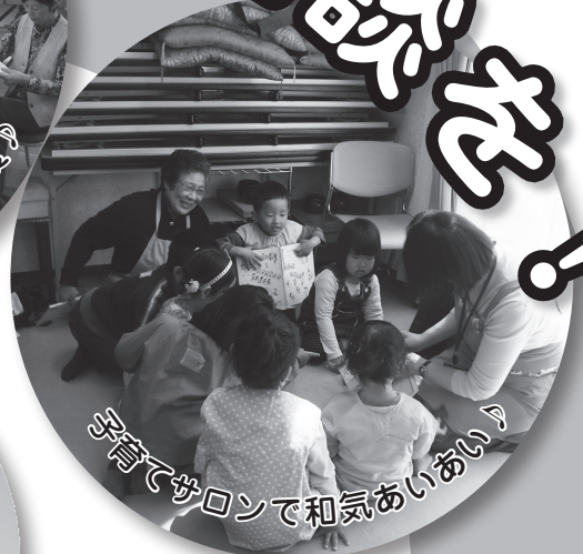
子育てサロンで和気あいあい♪