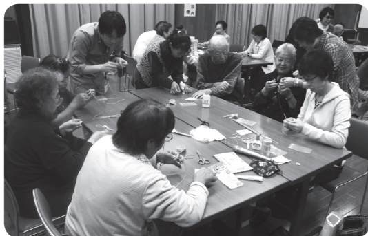
ふれあい手作り教室で5円玉を使ったストラップを作りました。