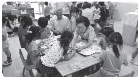
祖師谷保育園の園児と地域の高齢者との交流会「はびねすの会」を開催しました。