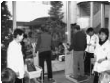
奥沢地区社協 ～ インボディ測定 ～

URL http://www.setagayashakyo.or.jp e-mail: stshakyo@basil.ocn.ne.jp