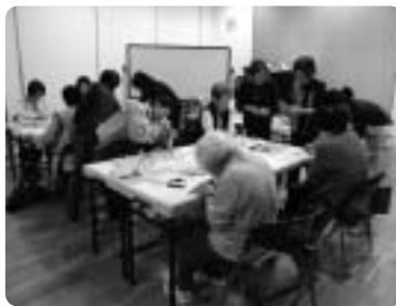
九品仏地区社協 ～ ふれあい事業 ～