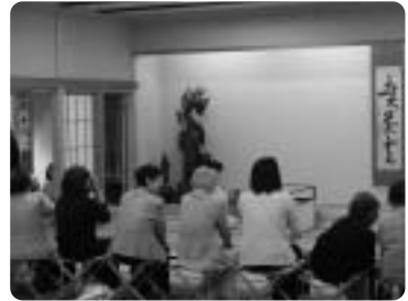
等々力地区社協 ～ 高齢者交流お茶会 ～

世田谷区社会福祉協議会は、 誰もがあんしんして暮らせるまち・世田谷を目指し、 区民の皆さんと共に福祉のまちづくりを進める 非営利団体です。