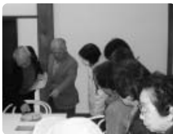
用賀地区社協 ～ 地域交流事業(旧用賀名主邸にて) ～