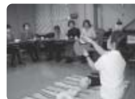
子育てサロン連絡会