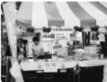
上野毛地区社協 ～ 古墳まつりでのPR活動 ～