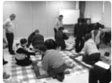
深沢地区社協 ～ 救命救急講習会 ～