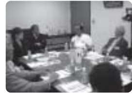
協力会員地域懇談会

介護予防や生活支援が必要な高齢者に対し、効果的なサービス提供の調整や地域ケアの総合調整等を行うために開かれる会議に参画し、地域内の関係機関との連携強化を図りました。