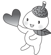
世田谷区社協キャラクター ココロ

世田谷区社会福祉協議会は、 誰もがあんしんして暮らせるまち・世田谷を目指し、 区民の皆さんと共に福祉のまちづくりを進める 非営利団体です。