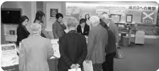
— (株)コクヨでユニバーサルデザインを視察 —