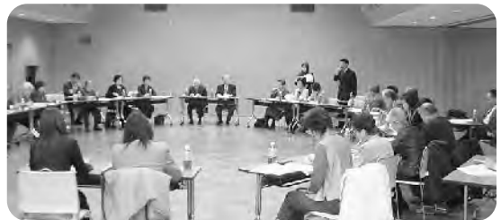
— 各地区社協の取組みについて意見交換 —

6地区(奥沢、九品仏、等々力、上野毛、用賀、深沢)の地区社協役員が、(株)コクヨにてユニバーサルデザイン(※)を視察、さらに各地区社協の運営や活動、今後の方向性について意見交換を行いました。最新の福祉の考え方を学びあい、役員相互の情報交換や交流を図ることが出来た一日となりました。