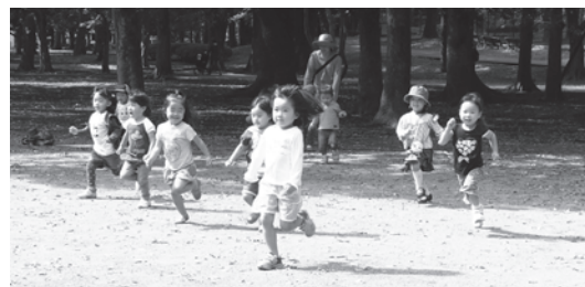
のびのび〜んず (子育てサロン)

活動曜日：毎週火曜日 活動場所：芦花公園花の丘 活動内容：公園遊び・食事会・おしゃべり