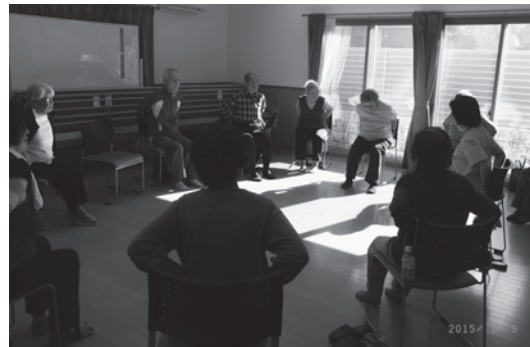
上北にこにこクラブ (サロン)

活動曜日：第1金曜日・第3水曜日 活動場所：八幡山ふれあいの家 活動内容：親子で簡単な手芸や工作、おやつづくりを楽しむ