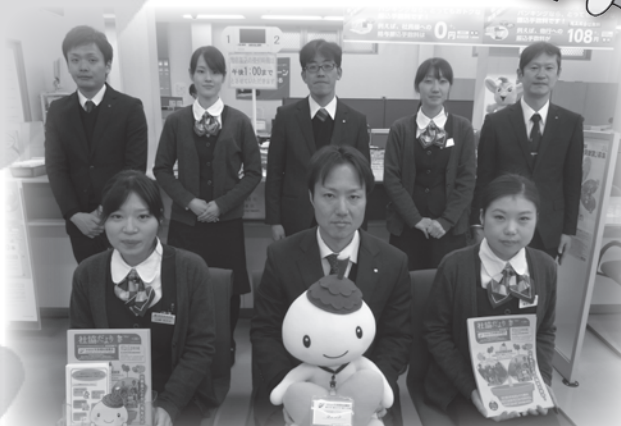
昭和信用金庫 上北沢支店の皆様