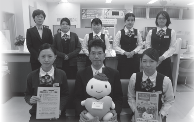
昭和信用金庫 八幡山支店の皆様

「社協だより」などを置いていただける 「社協協力店」を 常時募集しております。 ご協力をお願いいたします