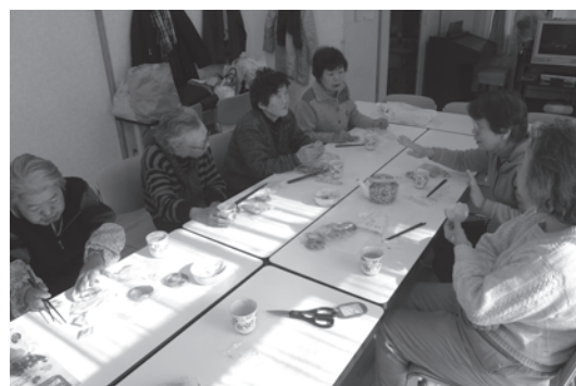
あしたばの会 (サロン)

活動曜日：第1・3金曜日 活動場所：フォーライフ桃郷1階 活動内容：健康体操・懇親