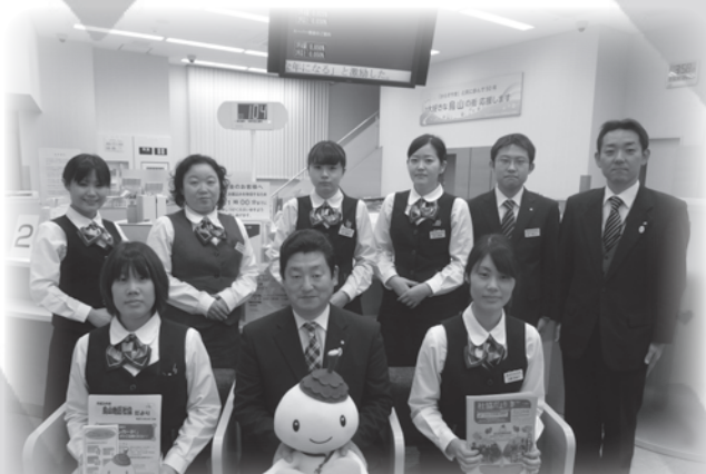
昭和信用金庫 烏山支店の皆様