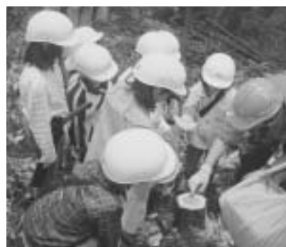
力をあわせて切った木を観察中 (ひとり親家庭一泊交流会)

世田谷・北沢地域合同で、24家族60名の参加者が川場村の自然の中で、すいか割り・ハイキングなどを楽しみました。