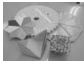
<コースター・鍋敷き・ゴミ箱など>

※クラフト技術交換会は、サロン・ミニデイのスタッフ同士がお互いの技術を交換し合うことで、グループ活動の役に立てていただくための自主的な集まりです。