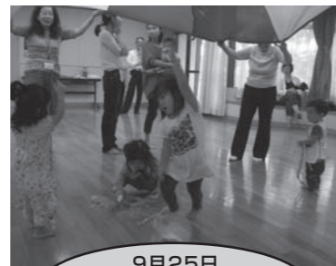
9月25日 親子ふれあい遊びと おもちゃ作り