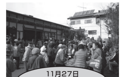
11月27日 高齢者交流会 行き先：川場村

平成26年度も社協会費、催し物へのご参加等、皆様にはお力添えを賜りますよう、お願い申し上げます。