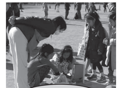
1月11日 船橋小学校 昔遊び