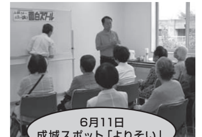
6月11日 成城スポット「よりそい」

今後も、頭を寄せ合い新しい事業を考えつつ、また、皆様のご協力をいただきながら活動を進めてまいりたいと思います。