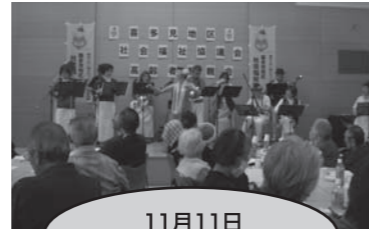
11月11日 高齢者懇親会