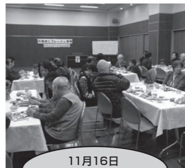
11月16日 介護者リフレッシュ事業