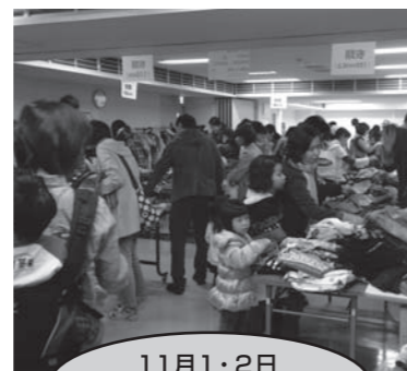
11月1・2日 子ども用品交換会