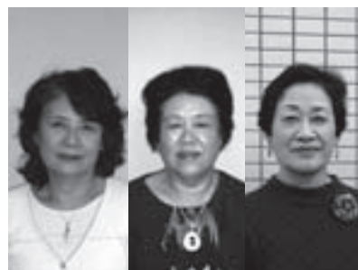
左から 都崎副会長 荒川会長 榎本副会長