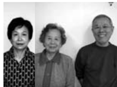
左から 松下副会長 大原会長 佐藤副会長

あんすこ（あんしんすこやかセンター）は、世田谷区が設置する相談窓口で、保健師等専門職員が高齢者の介護や生活全般の支援を行っています。