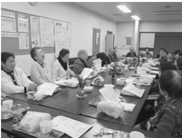
若紫の会 ～おしゃべりを通じて情報交換～