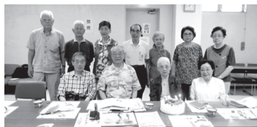
こすもすの会 (サロン)

活動曜日：第1・3月曜日 芦花ホーム 第4日曜日 南烏山ふれあいの家 活動内容：囲碁・ラジオ体操・会食(持参)