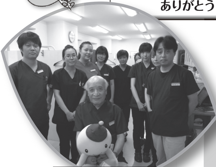
忠重歯科医院の皆様