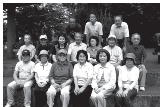
給田歩こう会 (サロン)

活動曜日：第2土曜日 活動場所：烏山区民センター 活動内容：趣味・健康・社会・福祉等について語り合う