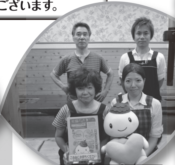
焼肉 六花苑の皆様