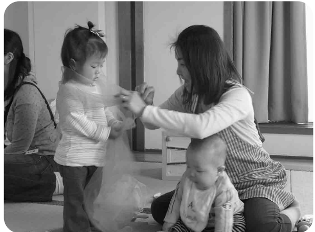
子育てサロン ぴゅあ