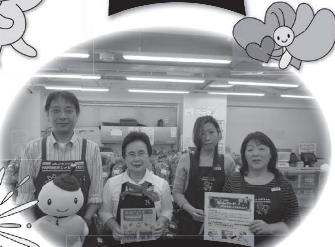
ファーマーズマーケット 千歳烏山店の皆様