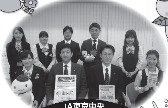
JA東京中央 芦花支店の皆様