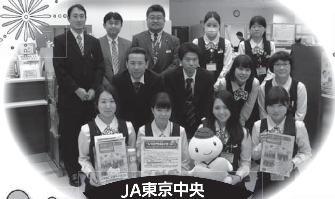
JA東京中央 千歳支店の皆様