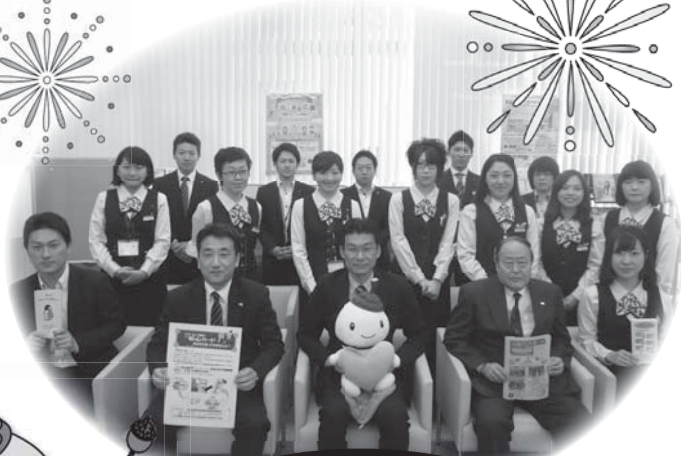
JA東京中央 烏山支店の皆様