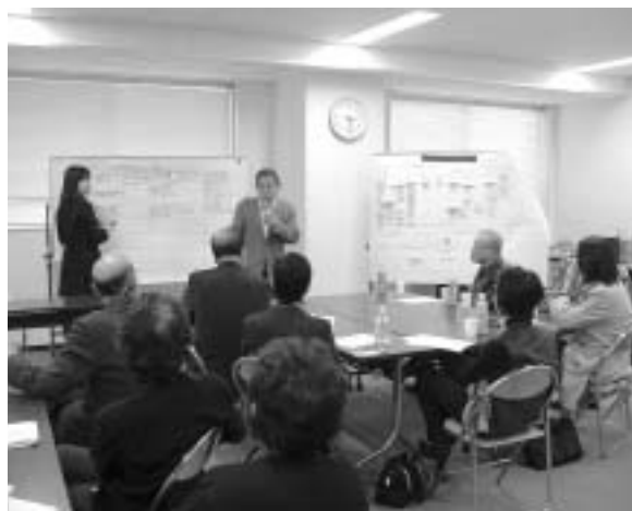
(理想の地域を話しあいグループ発表)

他地域に先がけて砧地域で地区社協が設立されてから、早くも2年半が経ちます。住民の皆さま自身による豊かな福祉コミュニティづくりは、年々充実した活動へと広がっています。