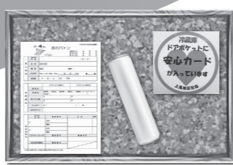
「命のバトン」による見守り活動