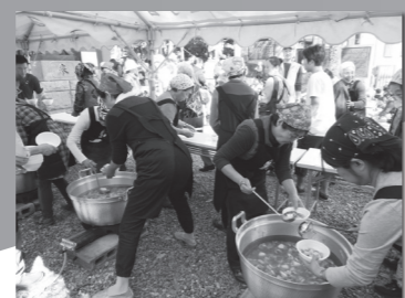
若林地区社協 芋煮会の様子

地区ごとに地区社協を設け住民が主体となった「 地区課題の解決に向けた 」取り組みを支援しています。