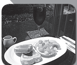
福祉喫茶の手作りスイーツ

知的障害のある方が一般企業に就労するために必要な能力を身につける場として、「 福祉喫茶 」を運営しています。