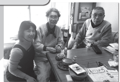
ふれあいサービスの活動の様子