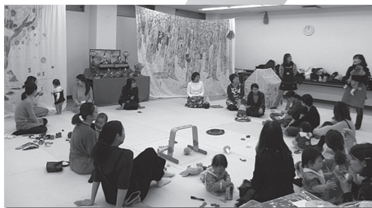
古民家 mamas の活動の様子

経堂地区 子育てサロン 「古民家 mamas」 「城南信金とのコラボで子育てが楽しくなるイベントを週1回開催中です。妊娠中、ご家族の方も大歓迎です。」 ●スタッフAさんより