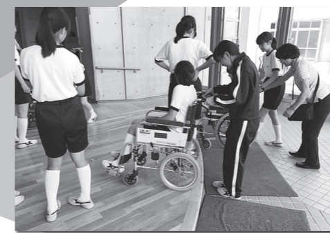
福祉学習体験の様子

学校・町会・イベント・企業などに職員等が出向き、車いす福祉学習体験を行っています。