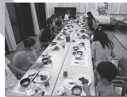
世田谷こども食堂・上馬の活動の様子

上馬地区子ども食堂 「世田谷こども食堂・上馬」 「共働きの世帯が増えると同時に子どもだけで食事をする“孤食”も増えています。私達はそんな子ども達に楽しい食事の時間を提供する事を目的に活動しています。」 ●スタッフKさんより