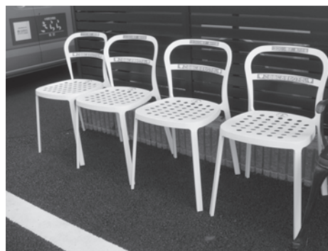
真っ白な『ココロン椅子』 設置にご協力いただける方募集中！