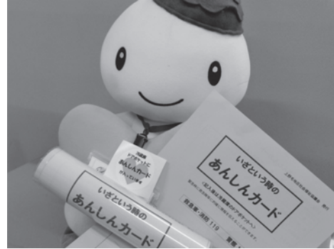
「あんしんカード」 いざというときの「安心」のために。