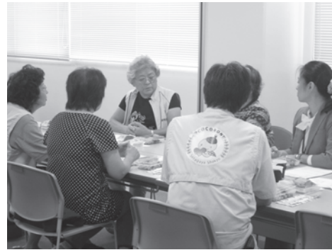
家族介護を行っている方の懇談の場を持ちます。