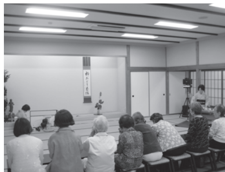
お茶会ではお琴を聞きながら、ゆったりとした時間を過ごしています。