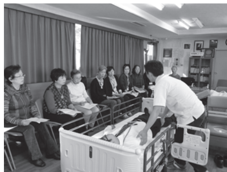
今年も「腰を痛めない」ための介護予防講座を実施します。