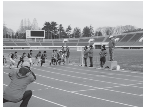
昨年度のふれあいマラソン大会の様子です。

各地区社協に関するお問い合わせは…玉川地域社協事務所 TEL：3702-7777 FAX：3702-7861