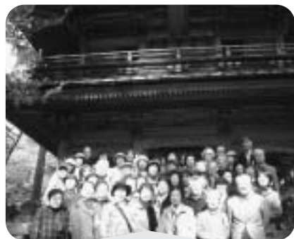
11月8日 ひとり暮らし高齢者交流会 行き先：群馬県川場村

きぬた地区社協は、発足以来、住民同士が協力し合う、住みよい地域となるよう事業を組んでまいりました。今年度は、「緑化まつり」など地域のイベントで福祉体験学習、「地域福祉推進員研修」では、地域の福祉施設の視察と懇談会、地区の敬老事業への助成、高齢者を対象にした「朗読会」、「絵本と紙芝居の会」、「ひとり暮らし高齢者交流会」、子育て中の親子を対象にした「親子ふれあい遊び」を実施し、地域の皆さん同士の交流を深めることができました。3月は地区ごとに地域福祉推進員さんの計画、発案で「70歳からの交流会」を実施いたします。来年度以降も、地域の皆さんと共に、きぬた地区の絆を深めることができるような事業を計画実施してまいりたいと思います。