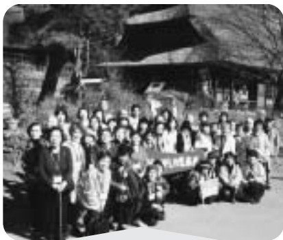
11月21日 高齢者交流会 行き先：西湖癒しの里根場

5月の総会で決定した事業が地域に定着することを目指して、活動を行ってきました。今年度初で行われた、成城スポット「よりそい」は外出が苦手な方を対象として、歌やおしゃべりを楽しんでいます。平成23年9月から開始し、成城あんしんすこやかセンター、地域の関係団体の協力により、株式会社メディカル・クーラ様の施設で、3ヶ月に1回開催しています。昨年は東日本大震災のため中止とした「バザー事業」も今年は開催する予定です。高齢者交流会、長寿の集い、DVD鑑賞会、推進員研修会、広報活動、健康推進事業、様々な事業を通じて「地元の社協」として、さらに多くの方々に親しんでいただきたいと思います。