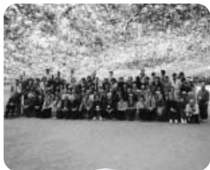
10月4日 高齢者交流会 行き先：諏訪、一宮