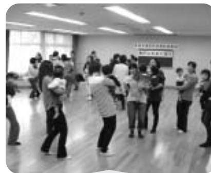
2月15日 親子ふれあい遊び