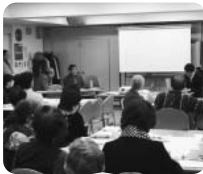
11月11日 地域福祉推進員研修会 「災害時要援護者に対して地域ができること」