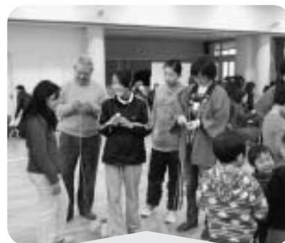
1月21日 船橋もちつき大会 昔遊び(コマ、お手玉など)