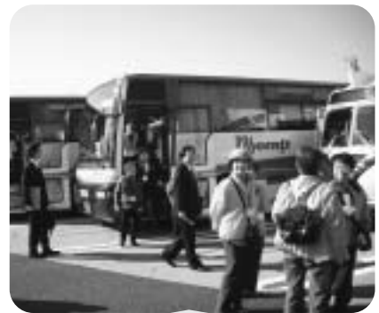
11月16日 高齢者バス交流会 行き先：伊豆修善寺