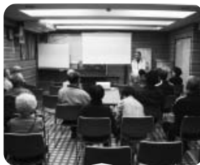
11月18日 映画会(喜多見) 「たそがれ清兵衛」