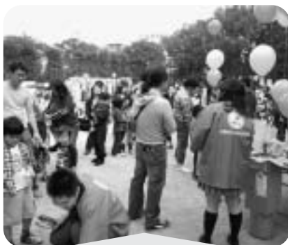
11月3日 船橋ふれあいまつり 風船、わなげ、クイズでPR

これらの事業が円滑に実施できたのは、偏に地域の皆様をはじめ、関係者のご協力があったからと感謝いたしております。新年度も更なるご理解とご協力をいただき、皆様と共に住みよい船橋地区になるよう活動してまいりたいと思います。