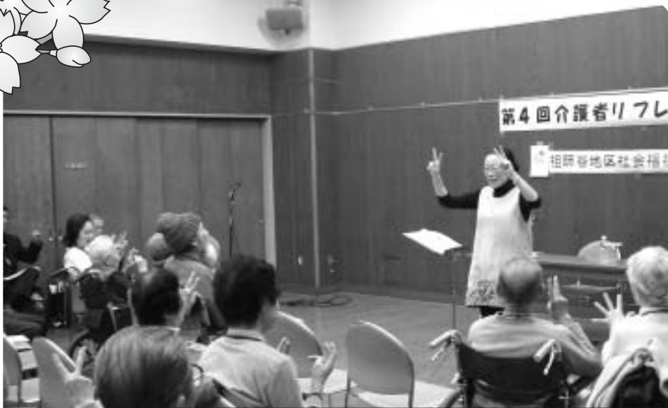
祖師谷地区社会福祉協議会 介護者リフレッシュ事業 12月3日