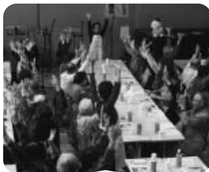
11月14日 高齢者懇親会 365歩のマーチの体操