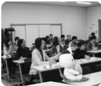
12月1日 推進員研修会 テーマ：「介護保険を知ろう」