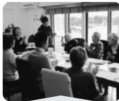
12月6日 成城スポット「よりそい」