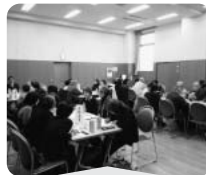
2月13日 サロン等交流会 講座、茶話会