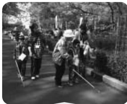
11月13日 砵ラリー アイマスク体験中