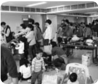
10月28・29日 子ども用品交換会

祖師谷地区社協は、住民の皆さんのご支援・ご協力により、これら事業を通じて地域のつながりを深め、住民の福祉マインドの醸成に努めてまいりました。今後も皆さんと共に地域福祉の推進・向上を目指して参りますので、一層のご理解とご支援をお願いいたします。