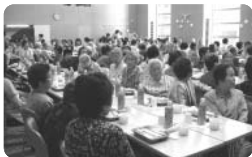
喜多見地区社協 高齢者懇親会の一コマ

各地区社協では住民の方々のご協力をいただきながら様々な地域福祉活動が行われています。地区社協の活動は皆様から納められた会費を財源とさせていただいております。今後とも地区社協の活動にご支援、ご協力いただきますようよろしくお願い申し上げます。