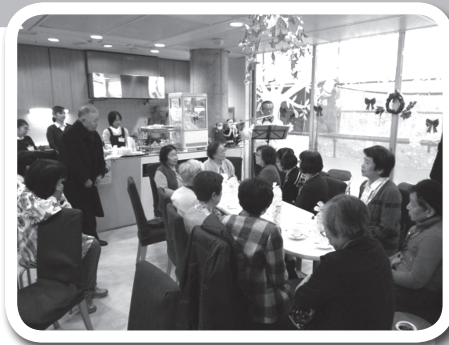
おしゃべり★カフェ