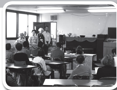
高齢者交流茶話会