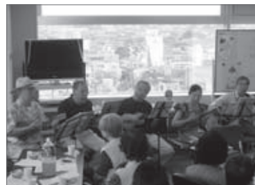
ウクレレの音色で気分も陽気に

今年1月に設立しました北沢地区社協です。初めてのことばかりで戸惑いもありますが、楽しみながら事業をすすめています。敬老の日に、「お茶のみ会」を北沢区民フロアーで開催しました。担当者はココロンマーク入りの黄色いベストを羽織り、26名の参加者さんをお出迎え。お茶を飲み、お菓子をいただき、ウクレレ演奏を聞き、みんなすっかり和みました。10月11日に開催された「多世代交流事業」も好評に終わることができました。今後も楽しみながら、ゆっくりと活動を続けていきたいと思っています。