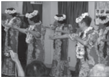
素敵な装いで見事なフラダンスを披露（くれない会）

6月7日(土)会場となった朝顔教会のホールに90名を超える方々が来場。熱気溢れる中、松原ふれあいの家や近隣で活動して