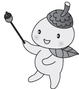
世田谷区社協キャラクター ココロン