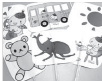
ココロンやサブキャラクターで作ったペープサート。左右や、裏表にくるりと返して動きを表現します。

9月25日(木)に開催した子育てサロンリーダー交流会では、サロンに持ち帰り利用して頂けそうなペープサートを紹介。その後有志の方にコ