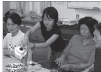
空いた湯飲みを探し自らお茶汲み（なかよし会にて）

夏休み期間を活用し、普段は学校へ行っている時間に地域で活動しているサロン・ミニデイに訪問し、スタッフとしてお手