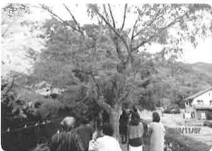
ひとり暮らし高齢者交流会