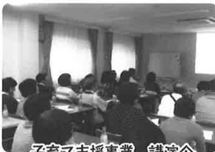
子育て支援事業 講演会 「地域で子どもを育てよう!!」