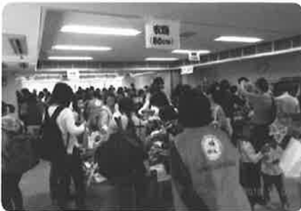
子ども用品交換会