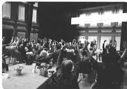
地域敬老事業「長寿の集い」