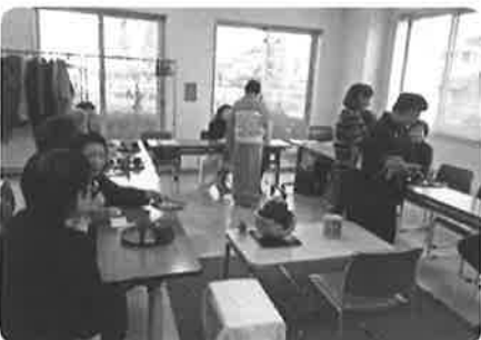
成城スポット「よりそい」