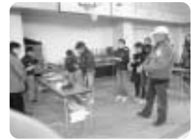
地区支えあい活動(昔遊び)