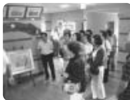
地域福祉推進員研修