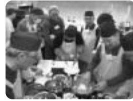
支えあいミニデイ