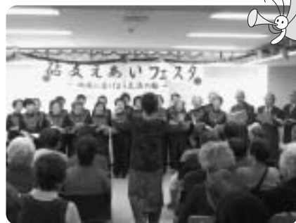
「わの会」による歌の発表

11のグループが歌や演奏、体操、朗読など、日ごろの活動の様子を発表しました。さらに、25のグループが編み物、財布、バッグ、絵手紙、短歌など、活動中に作成した作品を展示しました。来場された方も発表グループと一緒に歌ったり、作品を鑑賞したり…と思い思いに過ごされ、グループ間での交流が盛んに行われました。