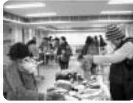
子ども用品交換会