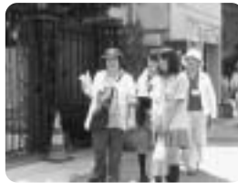
住みよいまちへの探健