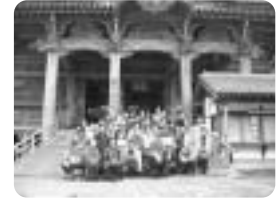
高齢者バス交流会