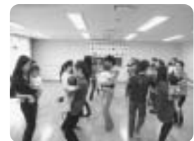
子育て支援事業 「親子ふれあい遊び」

※その他、各地区では、広報紙発行、社協会費募集活動、歳末たすけあい募金活動を行っております。 ※写真は平成22年度の事業風景です。