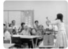
地域敬老「長寿の集い」