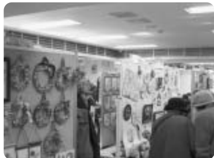
作品展示コーナー

平成18年まで実施していた砧地域でのサロン・ミニデイの活動発表や展示を再開してほしいという多くの要望に応じて、グループのリーダーが実行委員になり、「砧支えあいフェスタ2011」を平成23年3月5日に開催しました。当日は400名以上の方々にご来場いただき、大盛況でした。