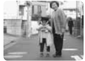
ふれあい子育て活動風景

どちらもボランティアの気持ちのある住民の方に協力会員（援助会員）として活動していただいています。