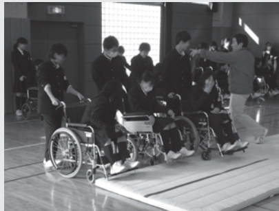
平成 25 年 12 月 13 日 (金) 松沢中学校 1 年生 『車いす体験・高齢者疑似体験・アイマスク体験』