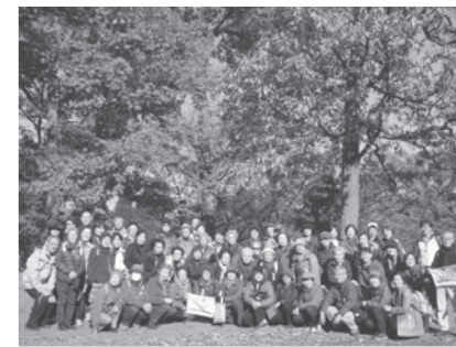
「秋の歩こう会・晩秋の文学散歩」 井の頭公園駅～三鷹～井の頭自然文化園 約8kmの道程 皆さん和気あいの楽しい一日でした！！