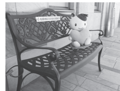
「だれでもベンチ」 有料老人ホーム「アリア松原」玄関横(松原5-34-6) お気軽にご利用ください