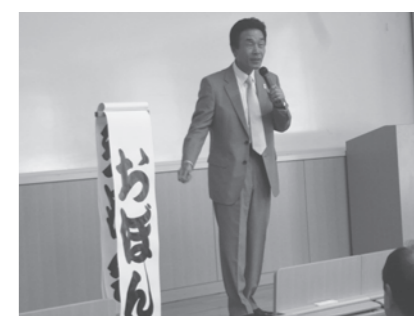
「高齢者お楽しみ交流会」 あの漫才コンビ「おぼん・こぼん」のおぼん師匠がピンでフリートーク！おなかを抱えて笑いました。