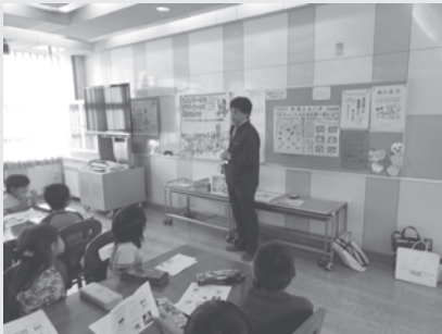
平成 25 年 12 月 3 日 (火) 東大原小学校 2 年生 『ユニバーサルデザインってなんだろう』

社協は、これからの地域を支えていく子どもたちと、学びを通じて思いやりの心をはぐくんでいきたいと考えています。