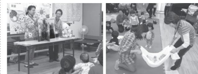
大型絵本「えらい、えらい」 バスタオルのゆらゆらは大人気

地域の方に抱っこされながら大型絵本やパネルシアターを見たり、ふれあい遊び（バスタオルでゆらゆら等）を楽しんだり、子どもたちも大喜びでした。参加したお母さんからは「色々な方に声をかけてもらい嬉しかった」との感想も寄せられ、お母さん方に子育て中の親子を対象とした活動に取り組む地域の方々の存在を知っていただける絶好の機会となりました。