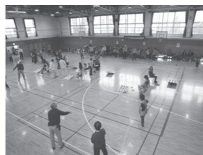
「わなげ交流大会」 得点が入るたび歓声が上がりました。