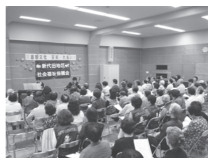
「文化・芸術ふれあい会」 二胡とピアノの多彩な音色に魅了された文化・芸術ふれあい会。音楽を通して交流の輪が広がりました。

地区社協は、地域の皆さまからの人的・財源的なご協力の下で活動を展開しています。皆さまからいただいた社協会費が、地区社協の明日を支えます。