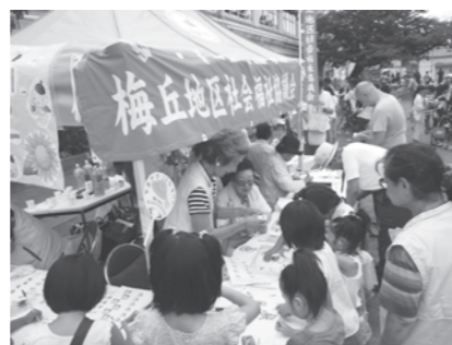
「小学校夏まつりへの参加協力」 これからも見守り支えあう活動をすすめていきます。