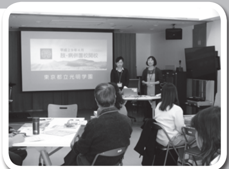
災害弱者支援講座