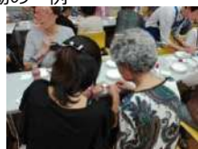
高齢者向けの交流イベントで一緒に手芸