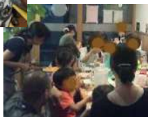
子ども食堂で調理などのお手伝い